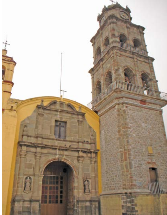
SAN JUAN BAUTISTA, IXTENCO