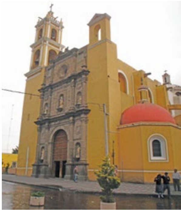
SAN LUIS OBISPO DE TOLOSA, HUAMANTLA