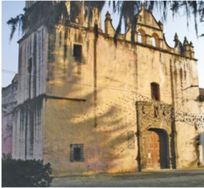
SAN VICENTE FERRER, CHIMALHUACÁN