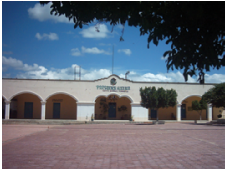
JUNTA AUXILIAR DE SANTO DOMINGO TONAHUIXTLA