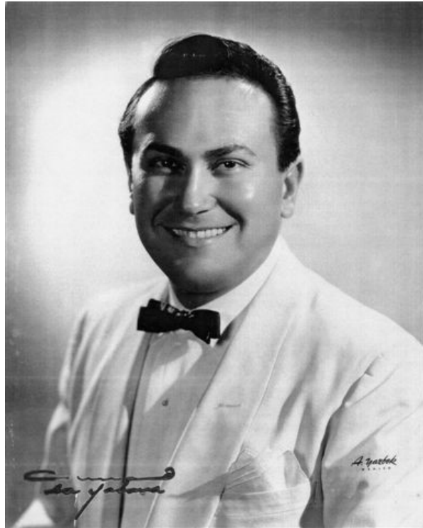
MÉRIDA, YUCATÁN