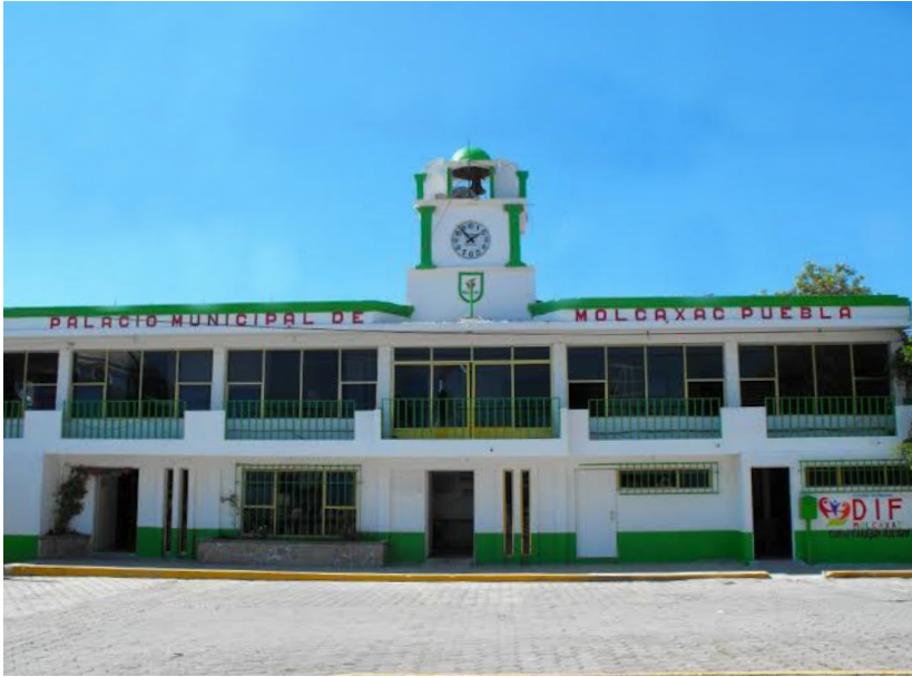
Presidencia municipal de Molcaxac