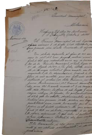
Correspondencia de 1911, el presidente auxiliar de Tehuizotla informa sobre la destrucción de su archivo por las fuerzas armadas