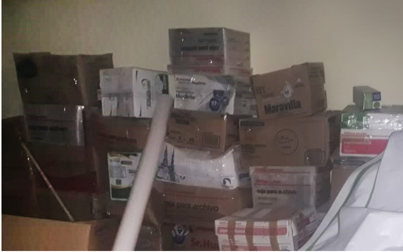
Antes del proceso