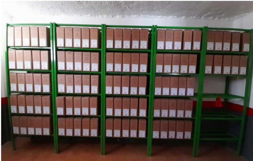
Después del proceso