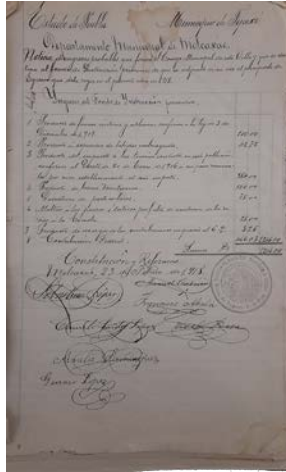
Ingresos y egresos, documento Fondos para la Instrucción Pública