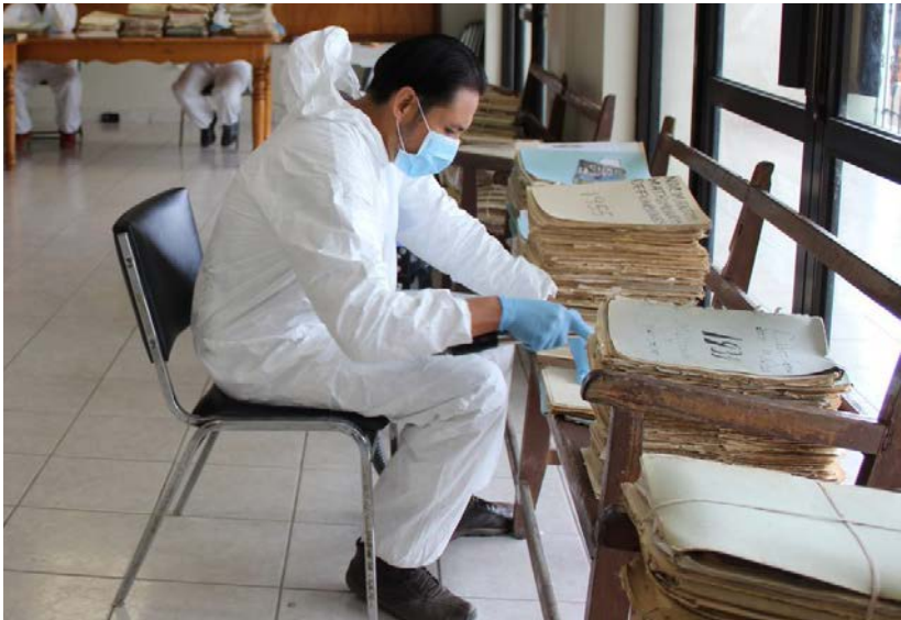
Durante del proceso