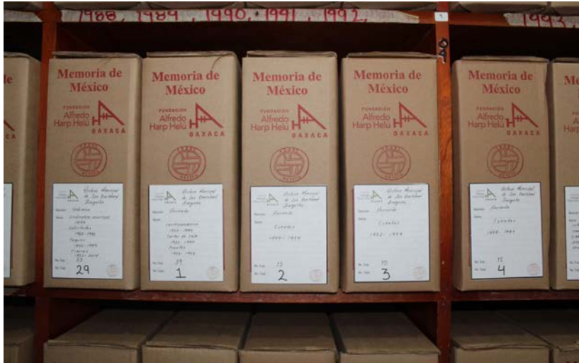
Después del proceso