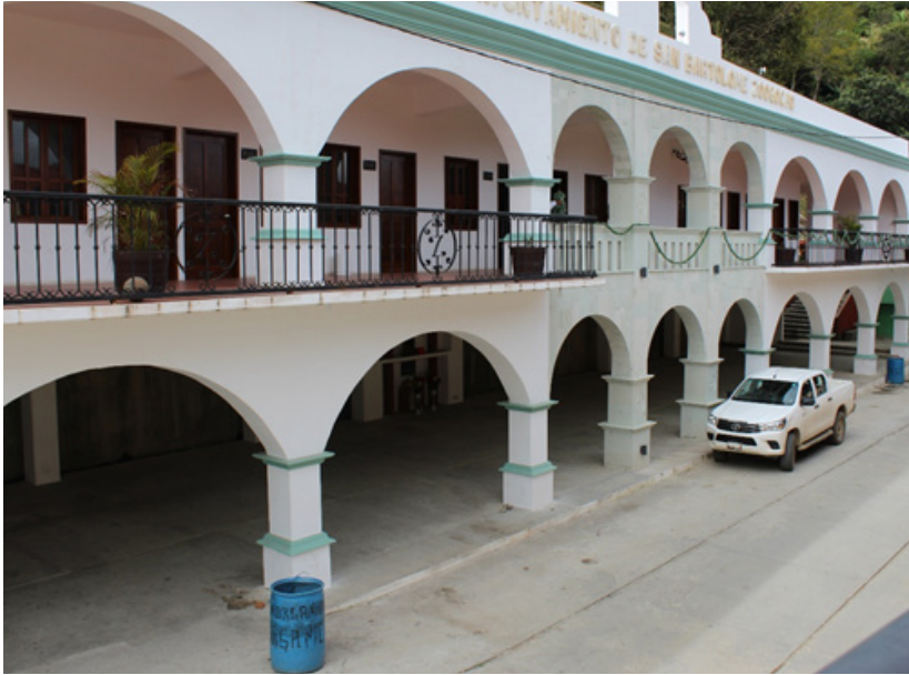
Palacio municipal de San Bartolomé Zoogocho