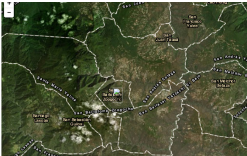
Mapa 3 3

La población se ubica a una distancia de 115 km de la capital del estado de Oaxaca. Sus colindancias son San Andrés Solaga, al este; al sureste, San Baltazar Yatzachi el Bajo; al suroeste con Santiago Zoochila y Santa María Tavehua, límite que se extiende hasta el noroeste. Zoogocho posee una superficie total de 1 307 hectáreas y se encuentra a una altura promedio de 1 520 metros sobre el nivel del mar. 4