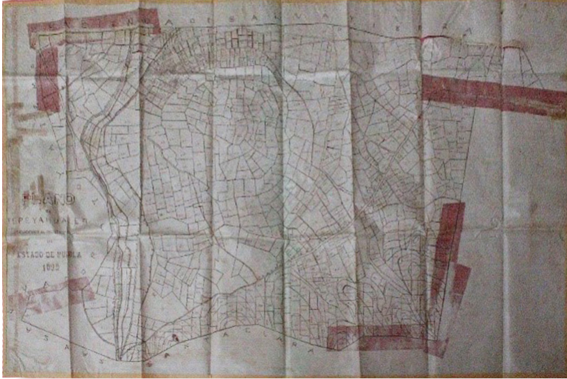
Plano de Tepyahualco de 1899