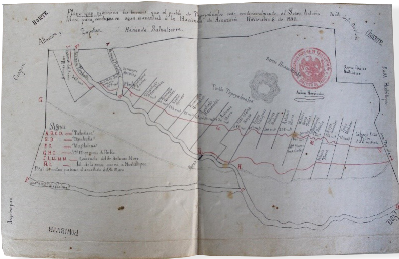
Plano de los terrenos que cede Tepeyahualco a Antonio Moro 1898