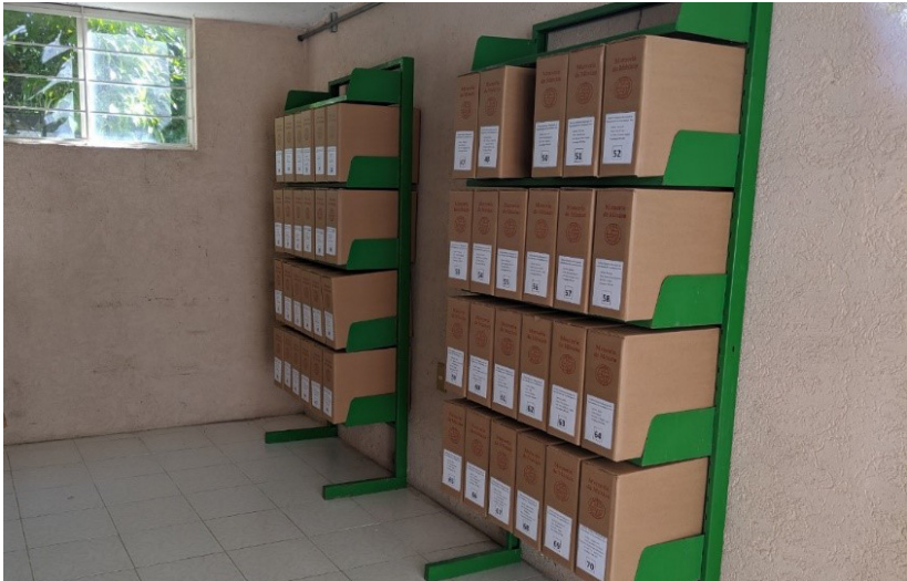
Después del proceso