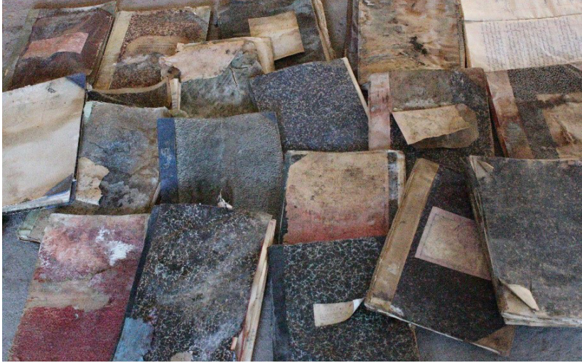
Antes del proceso