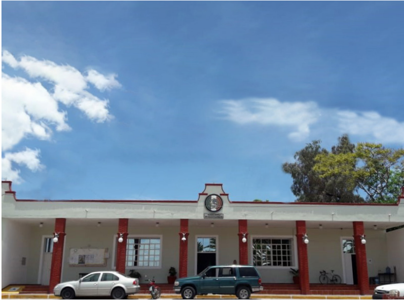
Presidencia municipal de Tepeyahualco de Cuauhtémoc