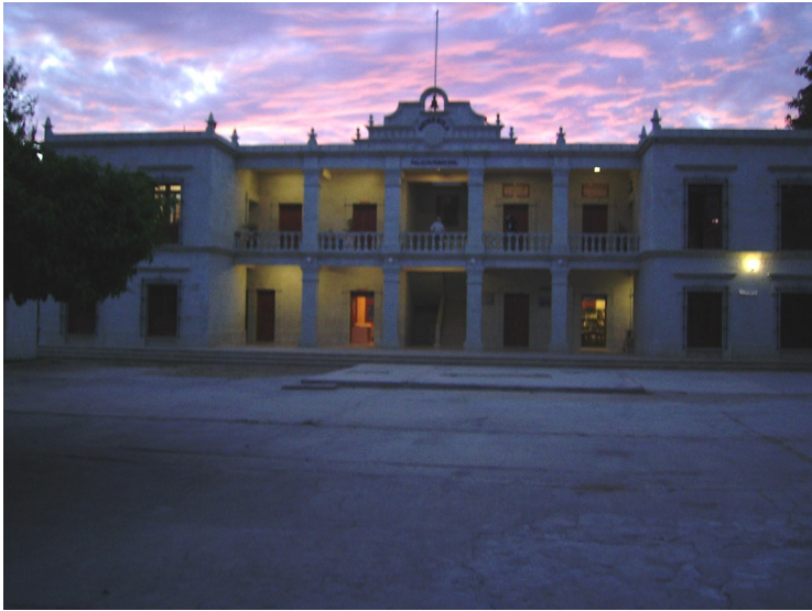
REYES ETLA OAXACA