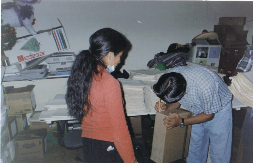
Proceso de organización e inventario