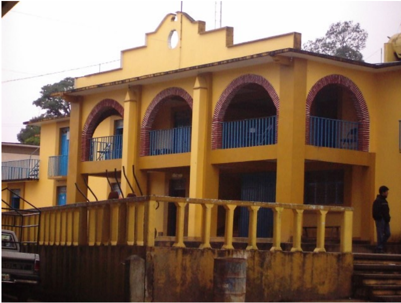
SANTIAGO ZACATEPEC MIXE OAXACA