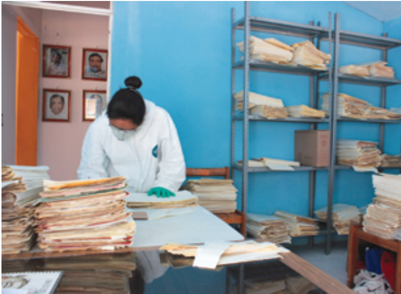
Durante el proceso