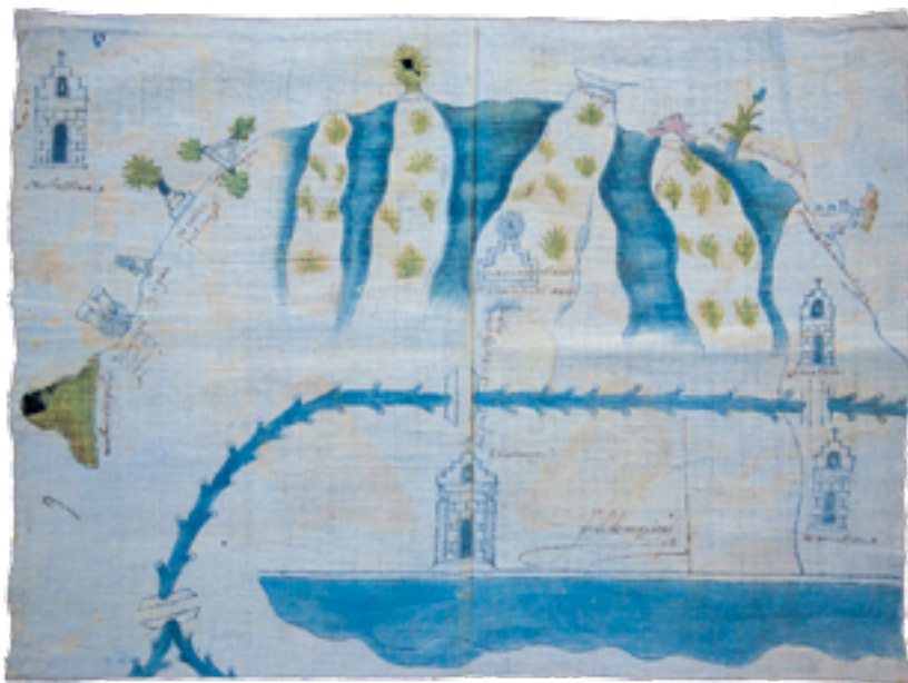
Lienzo de Etlatongo, mapa, 1582

Claudia Ballesteros César, responsable de la organización de las colecciones de la Fundación Alfredo Harp Helú, Oaxaca (FAHHO), colaboró en el trabajo de organización y descripción; asimismo, a fin de tener constancia del proceso, se incluyó la participación de Fidel Ugarte, fotógrafo de la FAHHO.