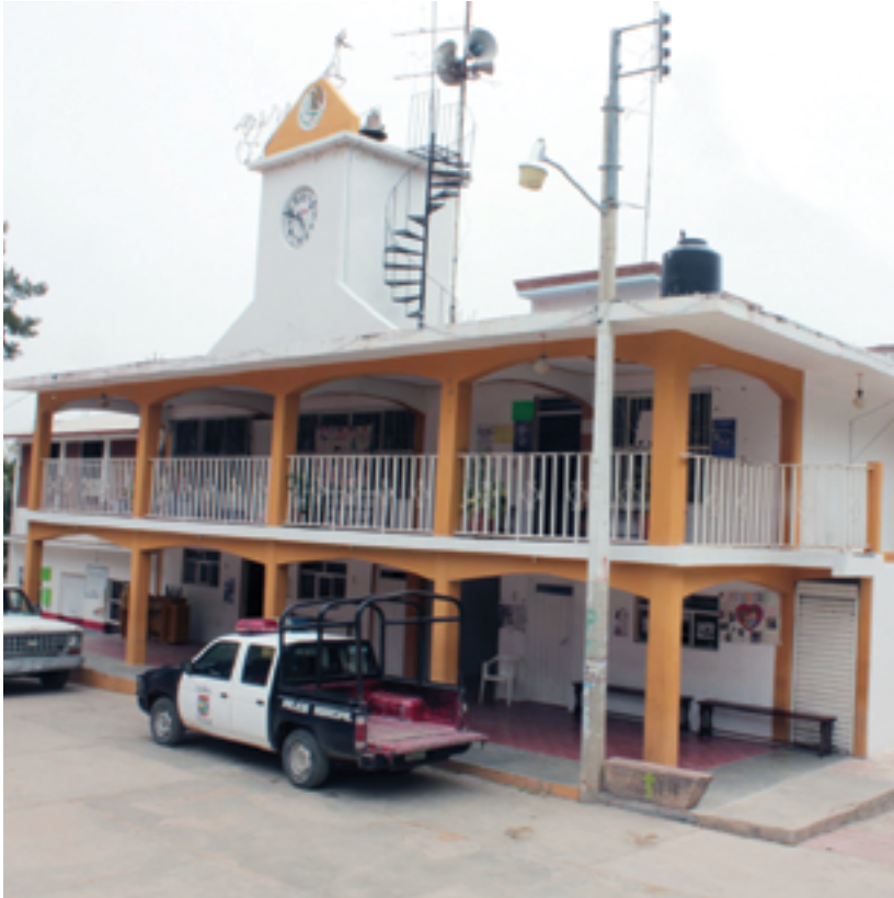
Municipio de San Mateo Etlatongo, Oaxaca