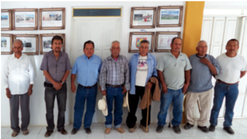
Presidente y expresidentes Etlatongo