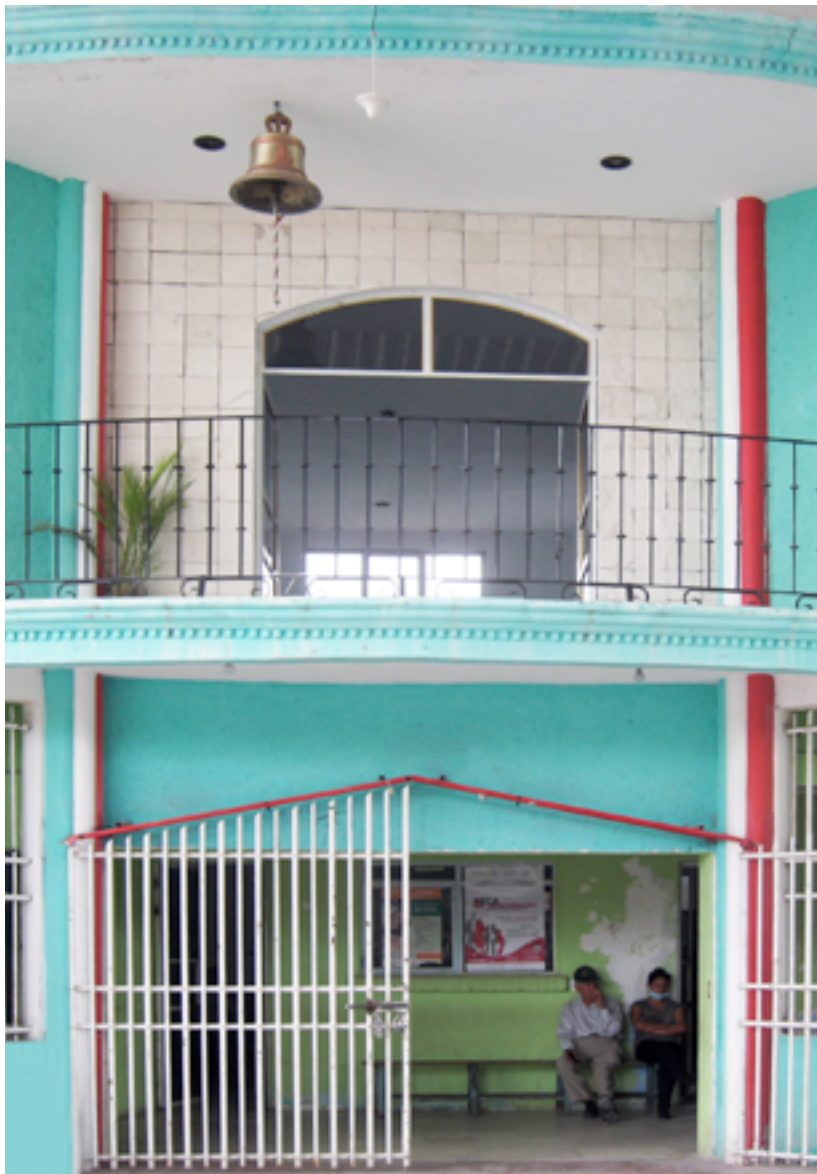
Palacio municipal de Zacapala, Puebla