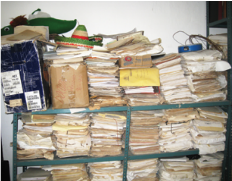
Antes del proceso