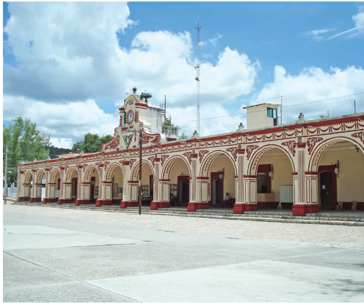
PALACIO MUNICIPAL DE SAN PEDRO Y SAN PABLO TEPOSCOLULA, OAXACA