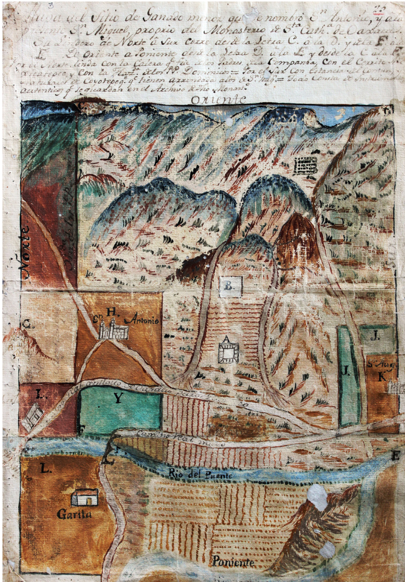
Mapa de las diligencias sobre los límites de tierras del sitio de ganado menor San Antonio a la presente Hacienda San Miguel del Monasterio de Santa Catharina de Oaxaca, 1775