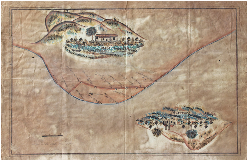
Mapa de las diligencias sobre los límites de tierras entre San Jerónimo Taviche, Zimatlán y la Hacienda Maya, 1779

El presente Inventario del Fondo Luis Castañeda Guzmán señala las series documentales en orden alfabético, que a su vez están ordenadas cronológicamente. Asimismo orienta a los estudiosos hacia numerosas líneas de investigación, no solo locales sino nacionales. Todo el fondo constituye un bien cultural bajo la custodia del pueblo oaxaqueño.