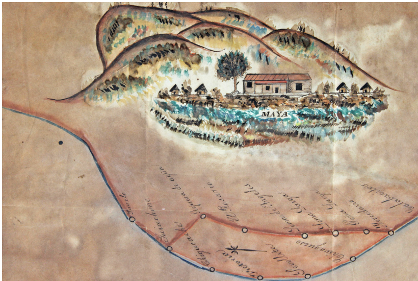
Detalles de mapa de las diligencias sobre los límites de tierras entre San Jerónimo Taviche, Zimatlán y la Hacienda Maya, 1779