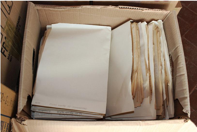
Durante el proceso