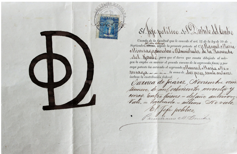
Patentes de ferros de la Hacienda el Rosario, 1895