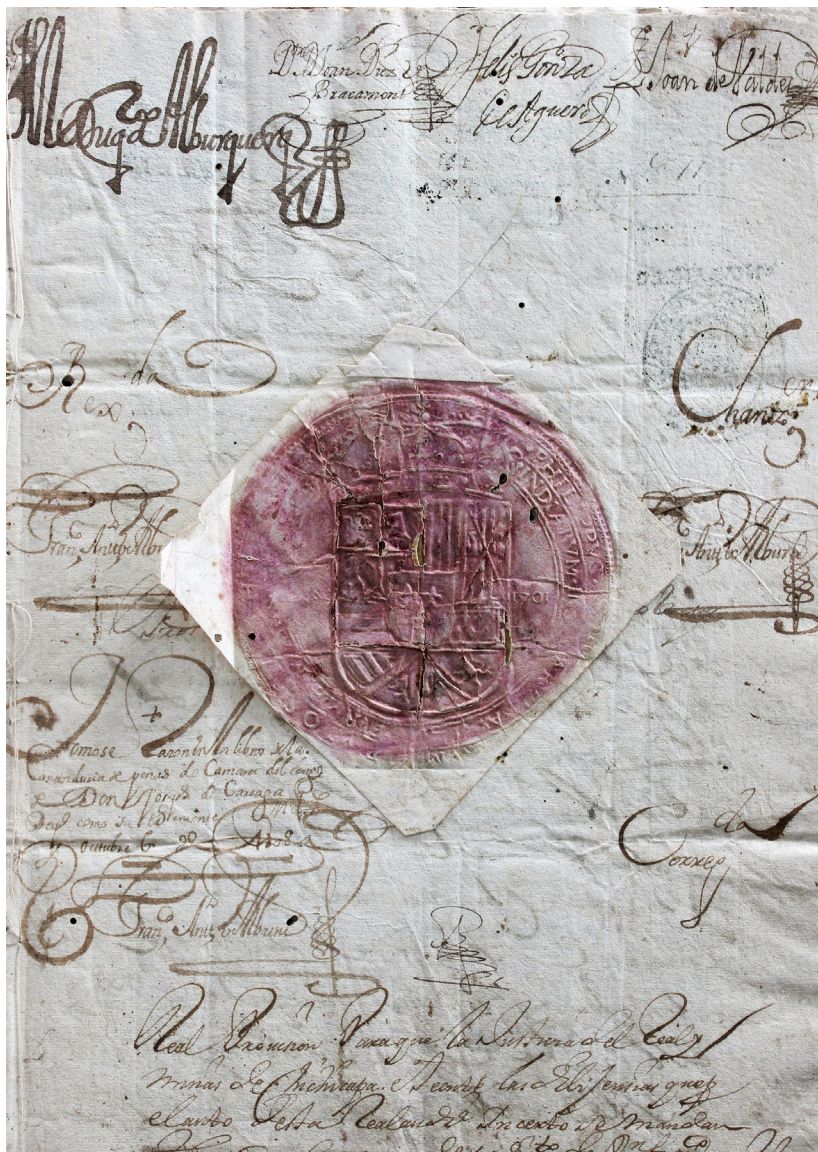
Real Provisión sobre las tierras de la Hacienda de Xaxe 1708 (sello de papel)