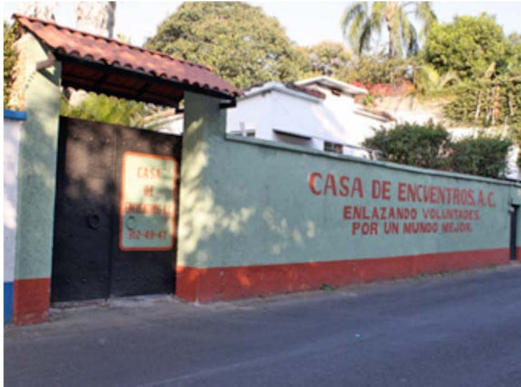
CASA DE ENCUENTROS A. C. CUERNAVACA, MORELOS