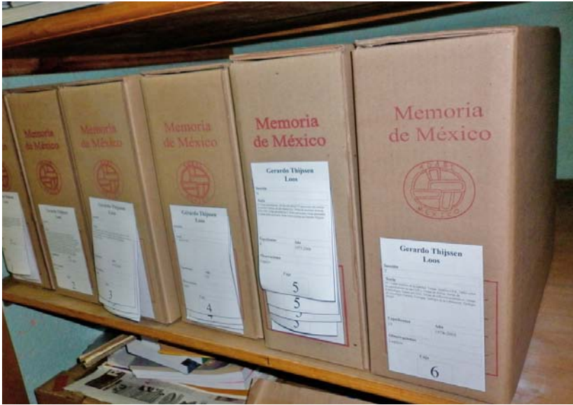
Después del proceso