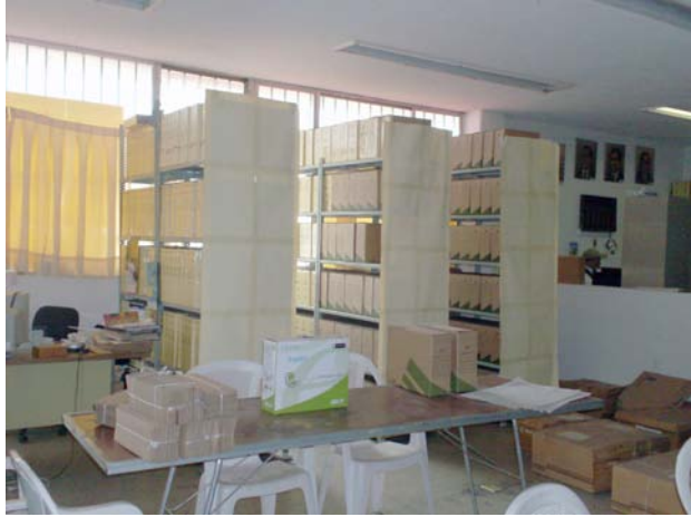
Antes del proceso