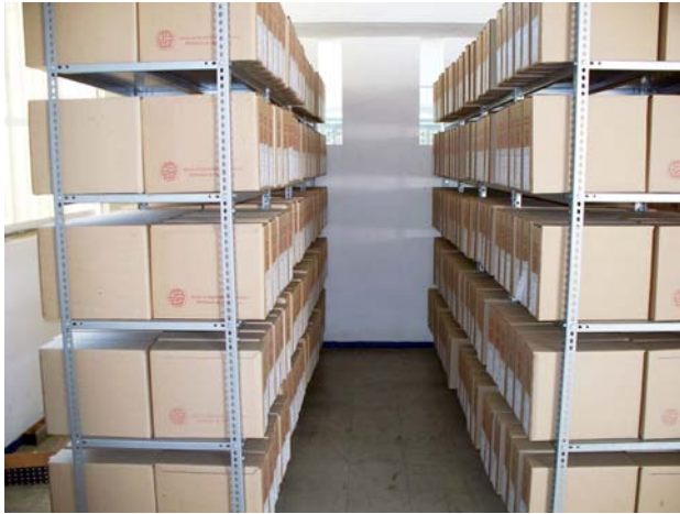
Después del proceso