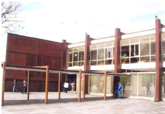
BENEMÉRITA ESCUELA NORMAL VERACRUZANA “ENRIQUE C. RÉBSAMEN”