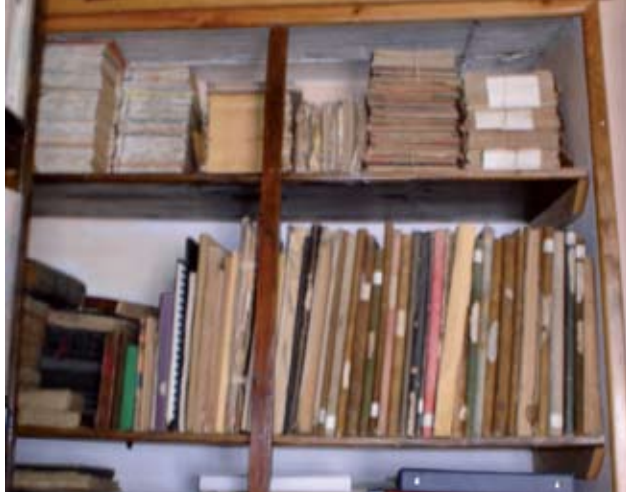
Antes del proceso