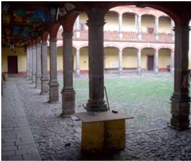
Espacios de la Hacienda de Tepalca