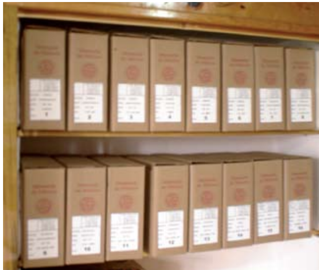
Después del proceso