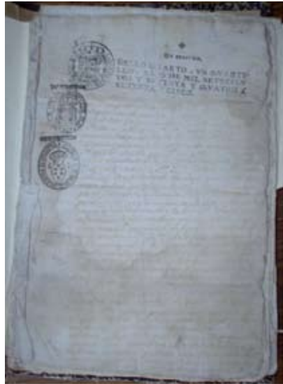
Algunos documentos y parte del Fondo fotográfico