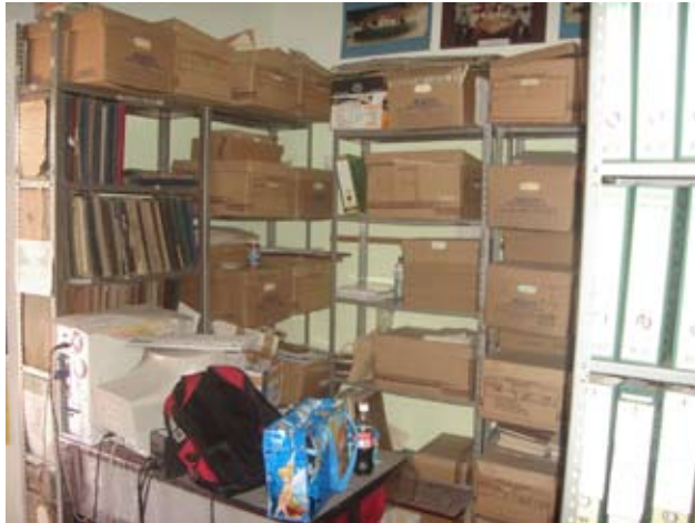
Antes del proceso