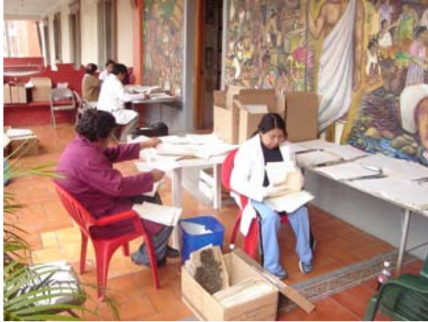
Durante el proceso