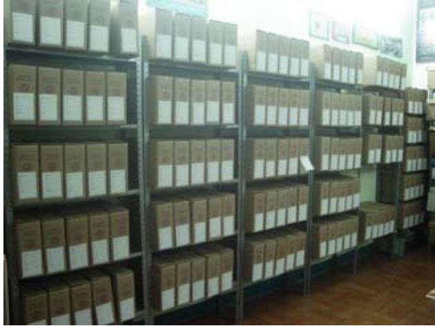
Después del proceso