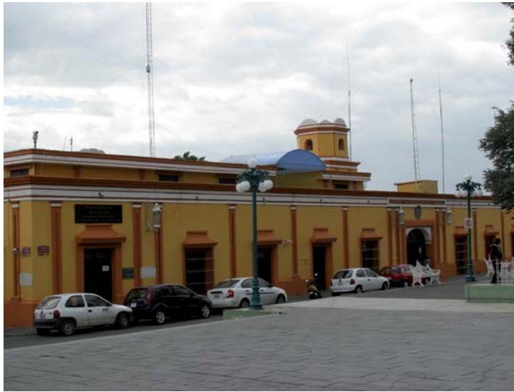
CHALCHICOMULA DE SESMA