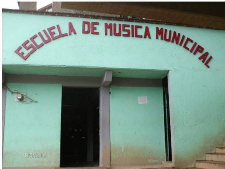
ENTRADA DE LA ESCUELA DE MÚSICA DE SANTA MARÍA TLAHUITOLTEPEC