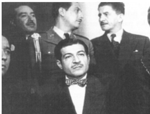
Cambio de la mesa directiva de la CNC, 1947

público federal hasta su fallecimiento el 12 de febrero de 1948 en el puerto de Veracruz. 4