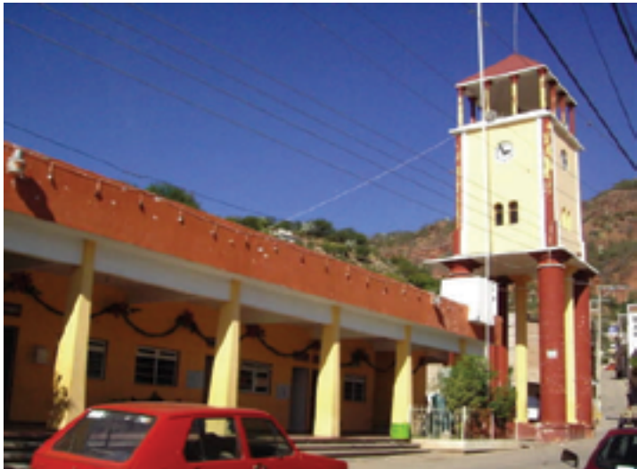
SAN JUAN BAUTISTA, CUICATLÁN