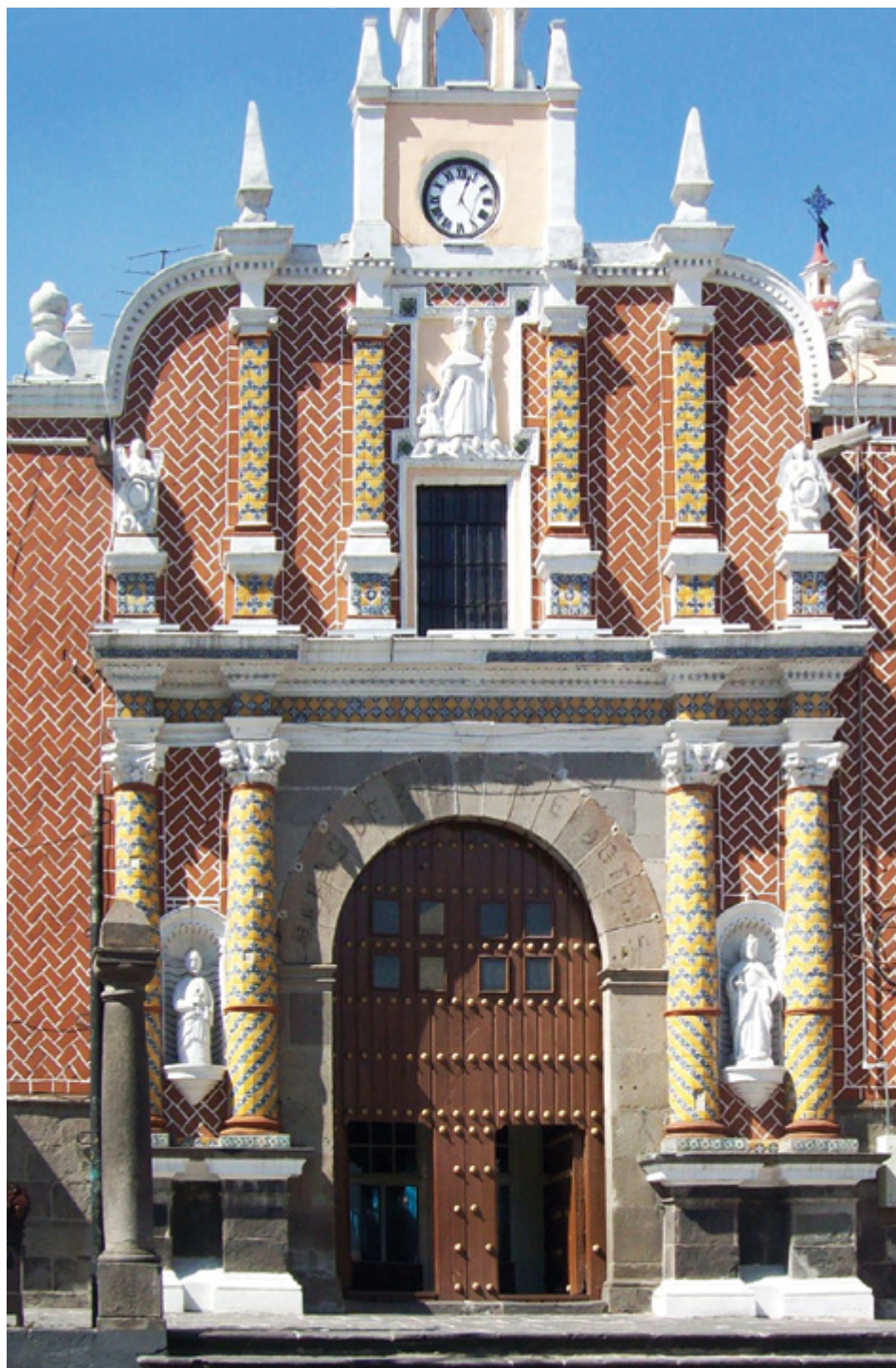
Parroquia del Señor San José