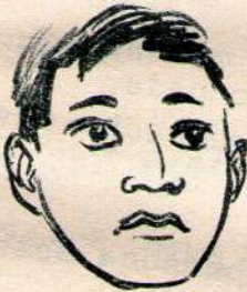
nka 4 kjai n 21 Cara.