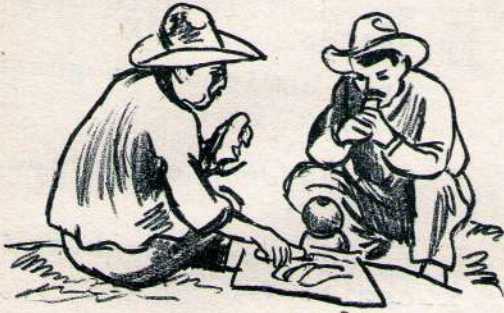
Tji 1 kjie n1 Estan comiendo.