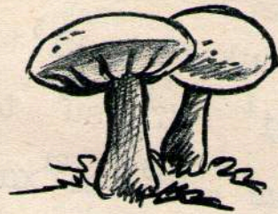
tjai n3 Hongo.