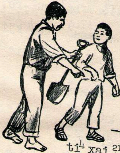
ti 4 xai 21 ¡Trabaja!