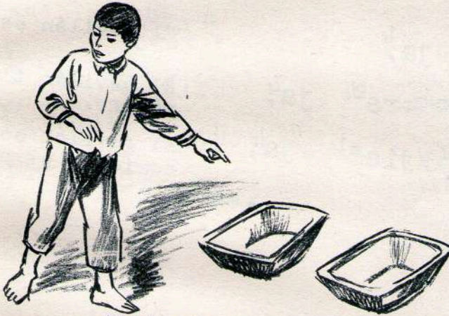
Tjia n2 nkia 3jo1 Están ambos.