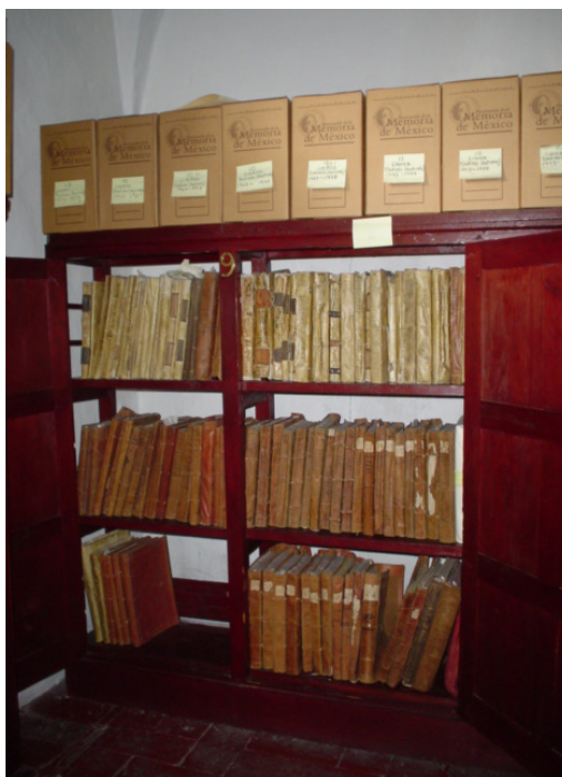
Archivo de la Parroquia del Sagrario metropolitano Iglesia de la Soledad