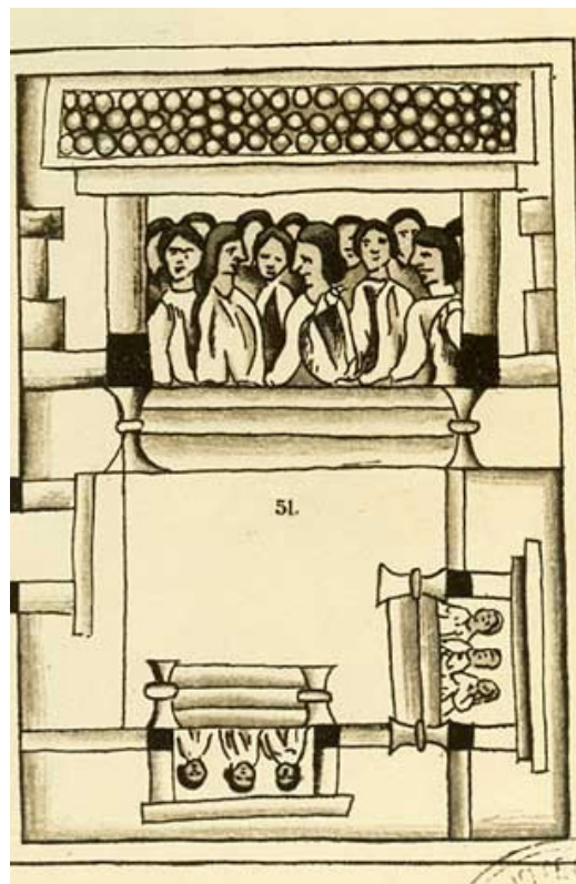
Historia de las Cosas de Nueva España, Códice Florentino, vol. I