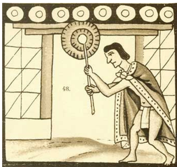
Historia de las Cosas de Nueva España, Códice Florentino, vol. I