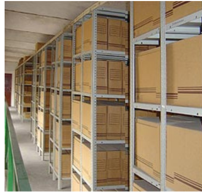
Estado actual de la documentación