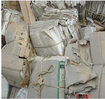
Estado de la documentación al inicio del proyecto, 1996.